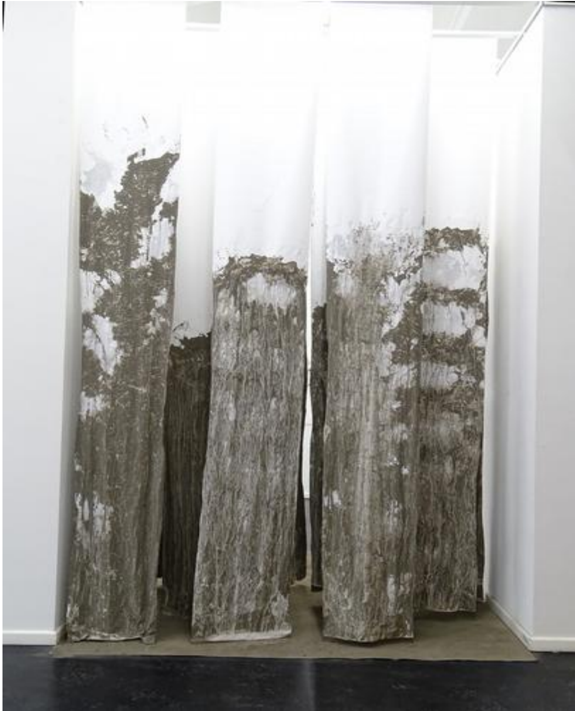
Spaced #2, gesamt, Ansicht von vorne

folgenden Auftrag auf das leicht-luftige Papier hat sich die eigentliche Konsistenz des Gesteins vollständig verändert und ist nicht mehr als Stein wahrnehmbar. Die Abdrücke auf dem Papier, die beim Auftrag des flüssigen Materials und dem anschließenden Trocknen der Bahnen entstehen, erinnern an geologische Formationen und an Ursprungsformen aus der Entstehungsgeschichte des Ölschiefers, dem ein unendlich langer Zeitaspekt immanent ist. Das Papier bringt sich beim Hängen und Trocknen selbst in die Form in der es zu sehen ist.