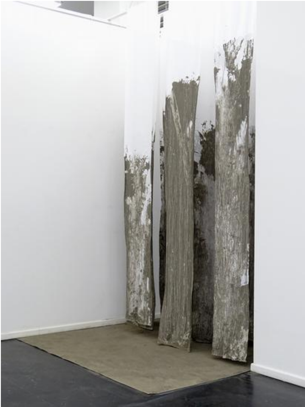
Spaced #2, gesamt, Ansicht von hinten. Unten: Ansicht gesamt von hinten