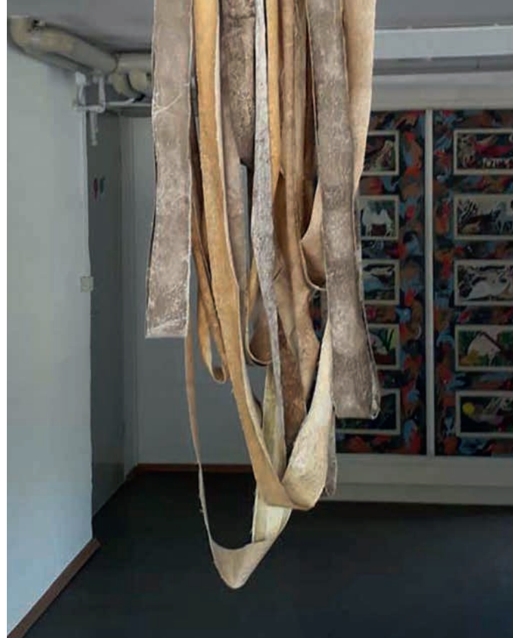
Zeit zurück bis zum Beginn der Erde Gestein auf Leinwandstreifen linienartig im Raum installiert.

Für Barbara Karsch-Chaieb bedeutet die Zerkleinerung des Gesteins einen enormen Kraftaufwand. Er wird so zerkleinert, dass man ihn als Farbe weiter verarbeiten kann. Hier verbindet sich die Zeit der Entstehungsgeschichte