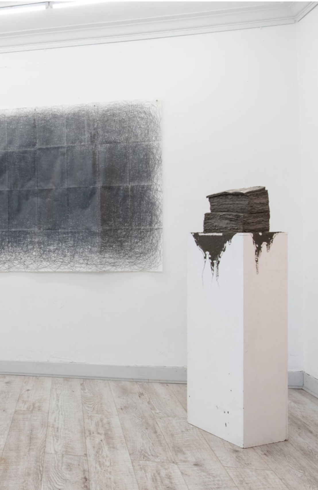
Ausstellungsansicht Galerie Wiedmann Exhibition view