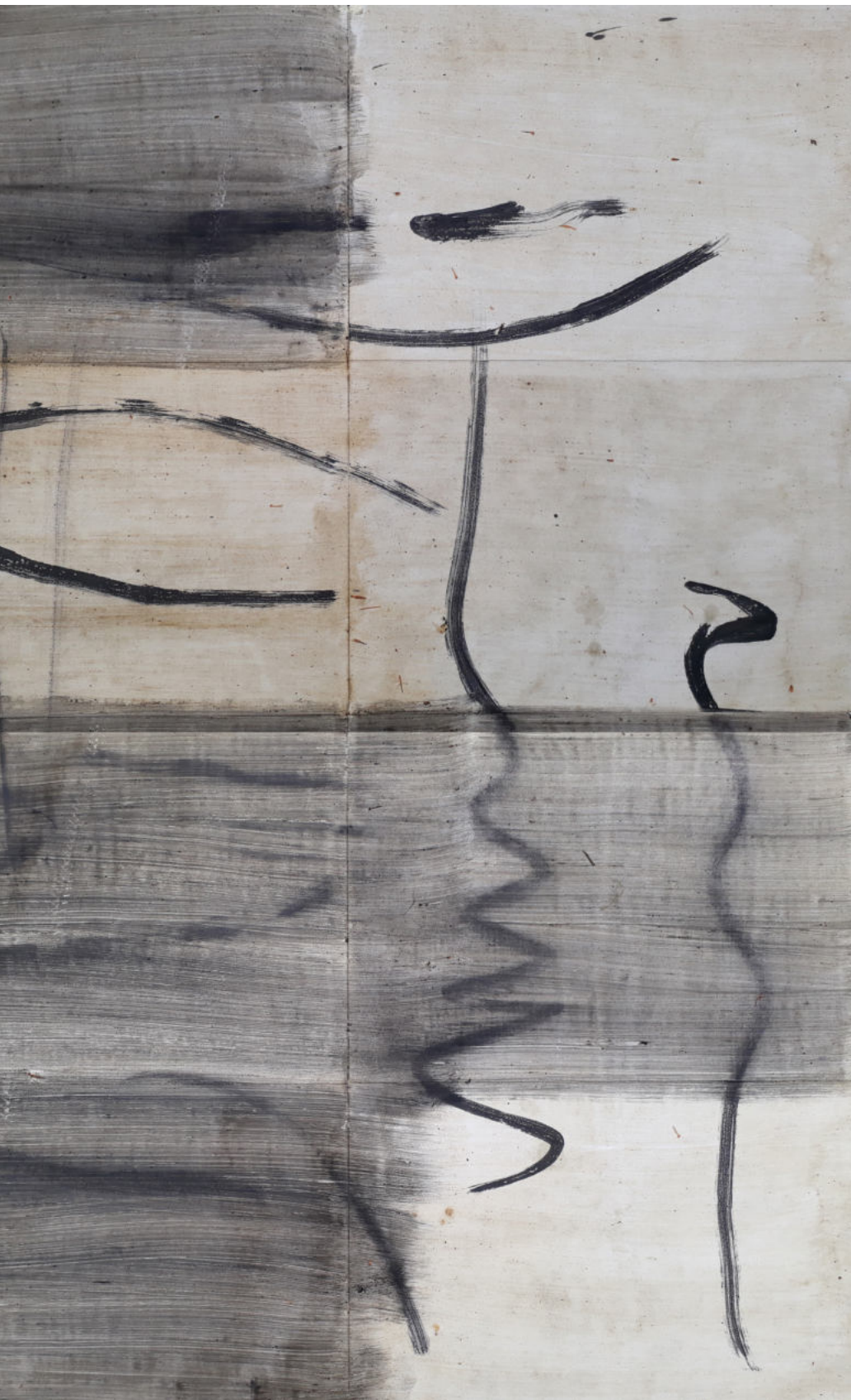
Silent whisper 2018