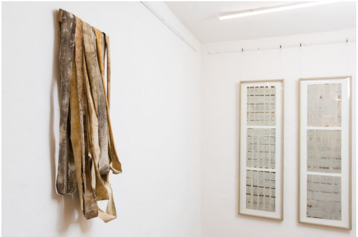
Gewächse #2, 2017 Leinwandstreifen mit Erdauftrag rechts: Layers No 3, 2001, Layers No 7, 2019 Schiefer hellst. und Ölschiefer auf Papier Growths #2, 2017 Canvas strips with earthpigments right: Layers No 3, 2001, Layers No 7, 2019 Slate and oil shale on paper