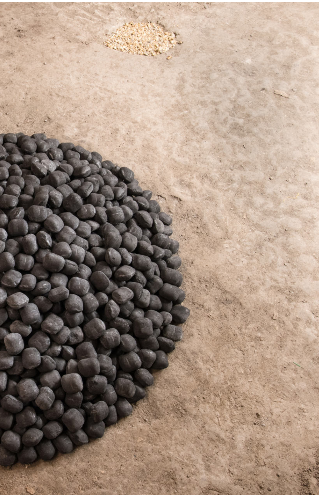
Kohle und Travertinstein im Keller der Galerie Coal and Travertinestone in the cellar of the Gallery